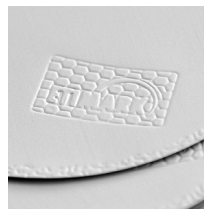
Éléments de marque mis en valeur par le gaufrage à effet 3D