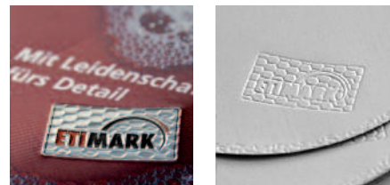
Elemente aus einer Marke mit 3D-Effekt-Prägung hervorgehoben.